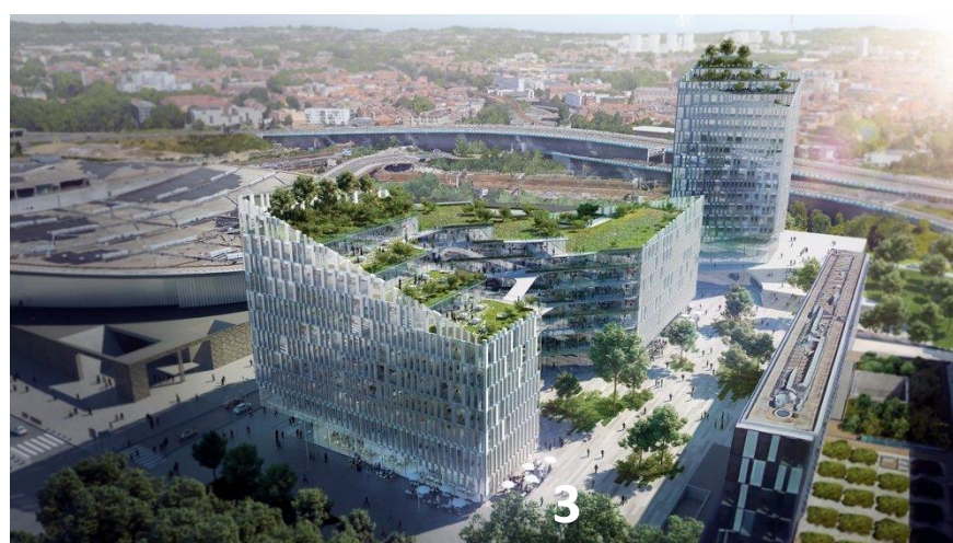
LE BIOTOPE – MOA : Linkcity – Bouygues Bâtiment Nord Est – Architectes : Henning Larsen - Keurk