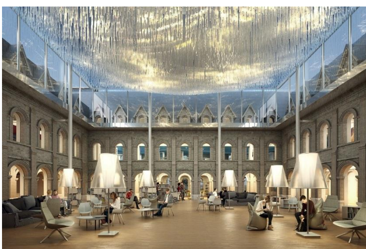
LES FRANCISCAINES – MOA : Ville de Deauville – Architectes : Moatti et Rivière Architecture – J.Y Houel